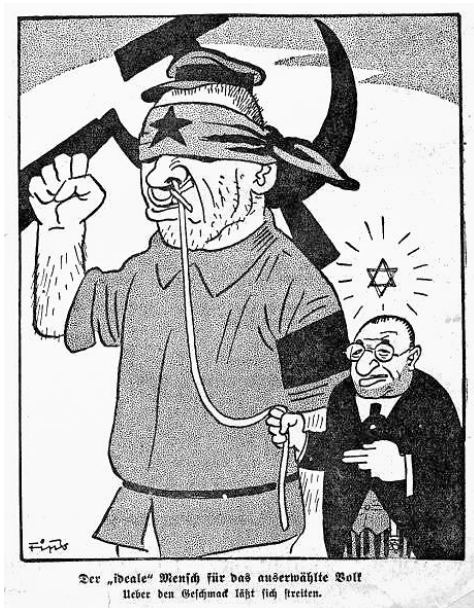
Užrašas: „Idealus“ asmuo išrinktiesiems žmonėms: dėl skonio neverta ginčytis.